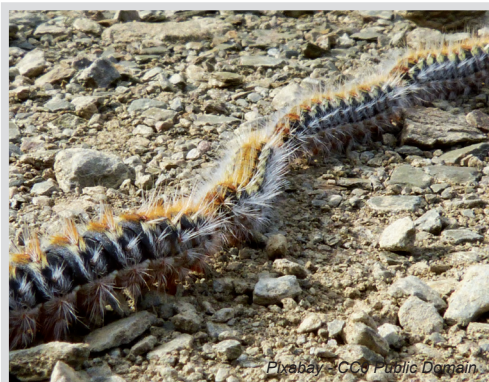
Pixabay - CC0 Public Domain